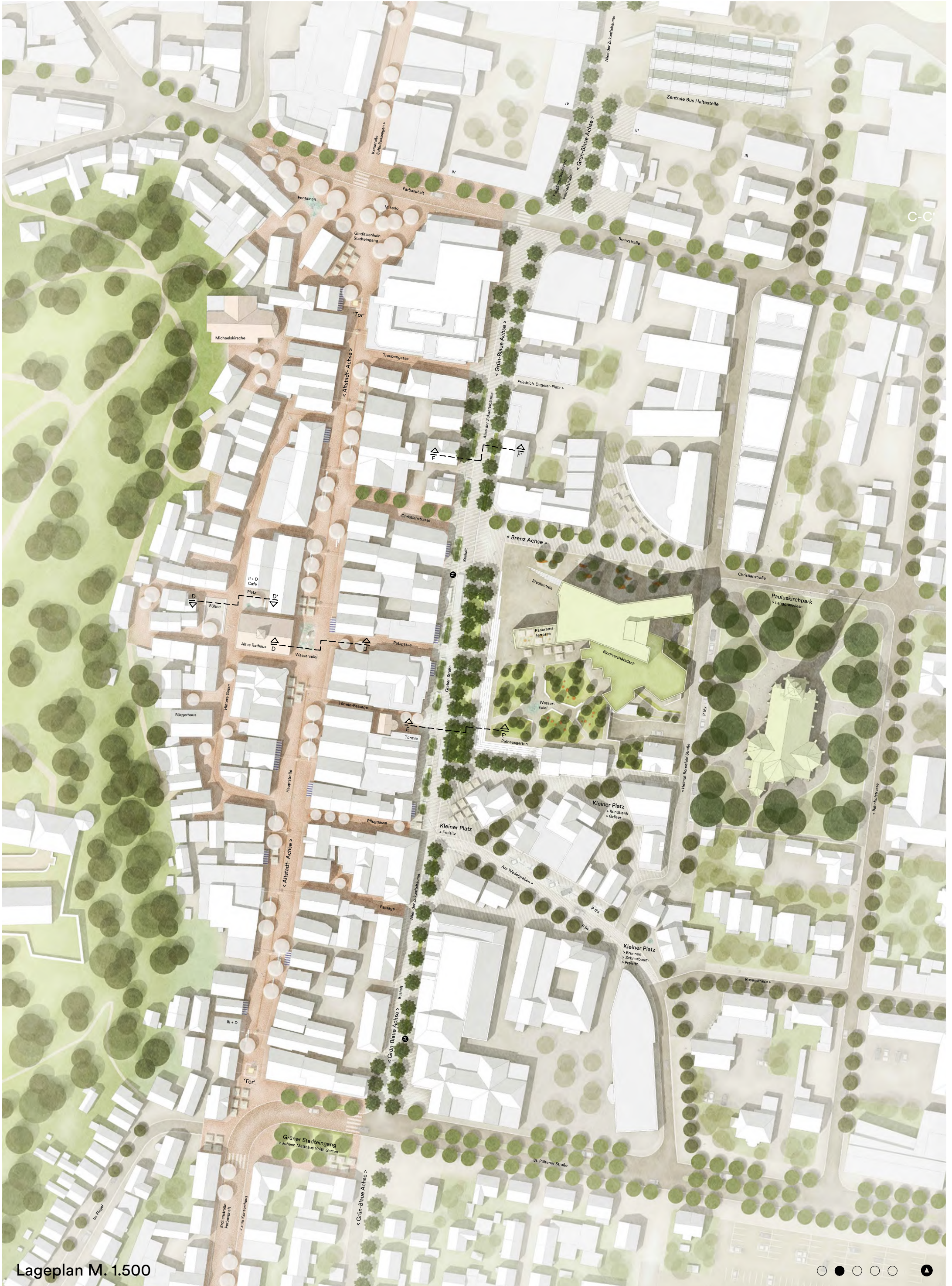
Lageplan M. 1.500